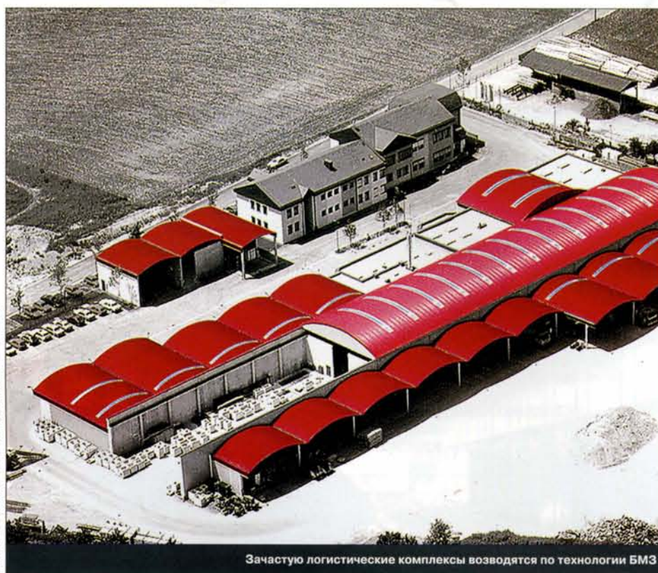
Часто логистические комплексы возводятся по технологии БМЗ

При этом число персонала, находящегося внутри складских помещений, как правило, невелико, а помещения расположены таким образом, что в случае возникновения чрезвычайной ситуации покинуть их не составляет особого труда. Товары, находящиеся на хранении, пострадают от огня гораздо раньше, чем произойдет обрушение металлических конструкций вследствие воздействия огня. Очевидно, что в рассматриваемом случае установка систем пожарной сигнализации и пожаротушения является более эффективным методом предупреждения значительных потерь от пожара, чем использование конструктивных элементов с высоким порогом огнестойкости.