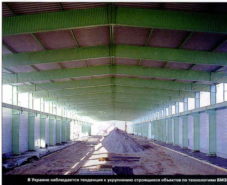
В Украине наблюдается тенденция к укрупнению строящихся объектов по технологиям БМЗ

• использование металла в качестве конструкционного материала обеспечивает большее разнообразие внешнего вида, архитектурных форм и цветовых решений зданий, чем другие строительные материалы;